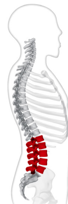
LWK 1 bis LWK 5