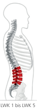
LWK 1 bis LWK 5

Das MKS® Leibteil passt sich durch das teilelastische Bandagenmaterial gut an den Körper an. Durch den aufgebauten zirkulären Druck wird die LWS gestützt. Das feste Verschlusselement sorgt hierbei für den erforderlichen Abdominaldruck. Optional kann eine durchblutungsfördernde Noppenpelotte oder Rückenplatte in die dafür vorgesehene Rückentasche eingeschoben werden.