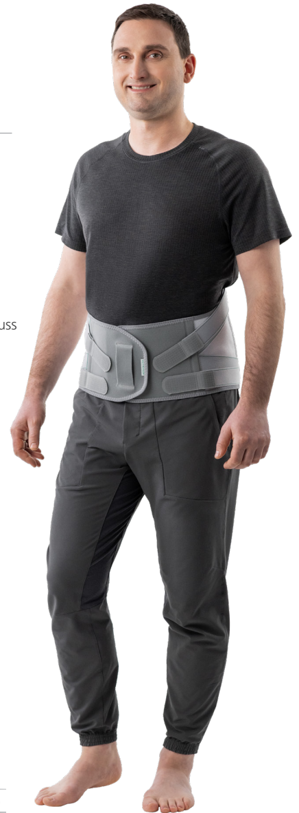
BWK 9 bis LWK 5